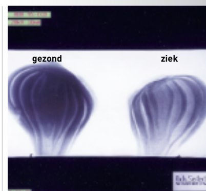
Figuur 2: Analyse van de röntgenfoto's.

M.b.v. een touchscreen wordt de machine bediend. Na het instellen van de soort bloembol (tulpe, hyacint, iris) en de bijbehorende maat, wordt de machine voor iedere partij geïjkt met +/-200 bloembollen. Het resultaat ziet u op uw scherm (zie figuur 3). In deze figuur worden op eenvoudige wijze door de operator van de machine de keurgrenzen ingesteld, en kan er gestart worden met het automatisch ziek zoeken. Verder biedt het scherm u de mogelijkheid om aanvoerparameters in te stellen zoals de snelheid van de bodemband en de trilplaatinstellingen.